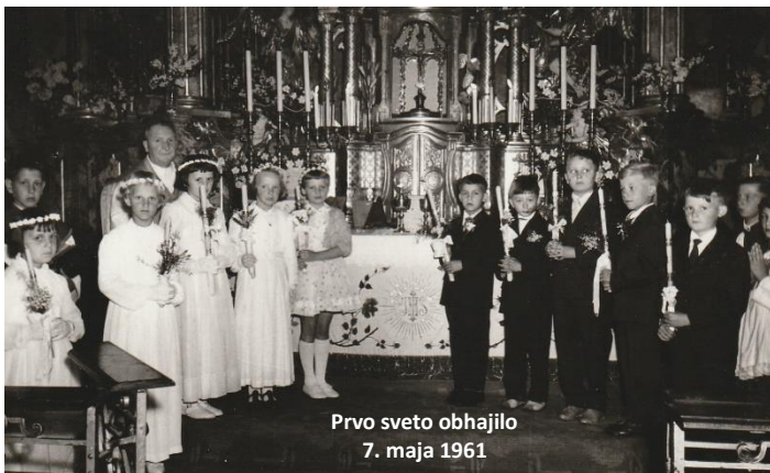
Prvo sveto obhajilo 7. maja 1961

11. Na veliko soboto ob 6. uri se izpostavi Najsvetejše v božjem grobu in ostane izpostavljeno do konca večerne službe