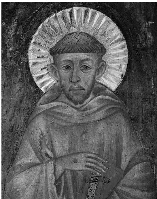
Osrednji lik: Frančišek Asiški

17.00 – sklepni piknik na dvorišču skupaj s starši.